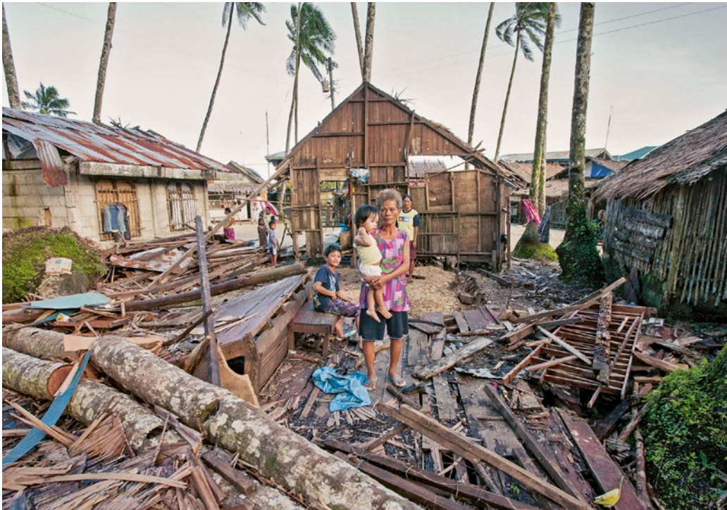
Unwetter, Überschwemmungen und Dürren häufen sich infolge der Klimaerhitzung. Betroffen sind vor allem Menschen im globalen Süden. Das neue CO 2 -Gesetz ist ein wichtiger Schritt für mehr Klimagerechtigkeit.