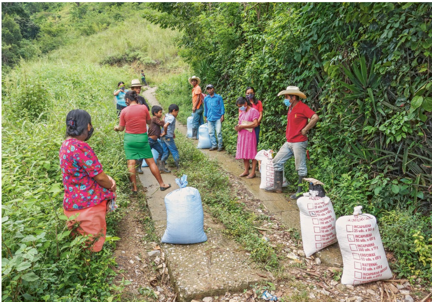
Die Nothilfepakete enthielten Grundnahrungsmittel, Saatgut sowie Hygieneartikel zum Schutz gegen Corona.

Brot für alle und Fastenopfer seit langem zusammenarbeiten. Gleichzeitig erhielten die Familien auch Informationsmaterial und Hygieneartikel, um sich besser gegen Covid-19 schützen zu können.