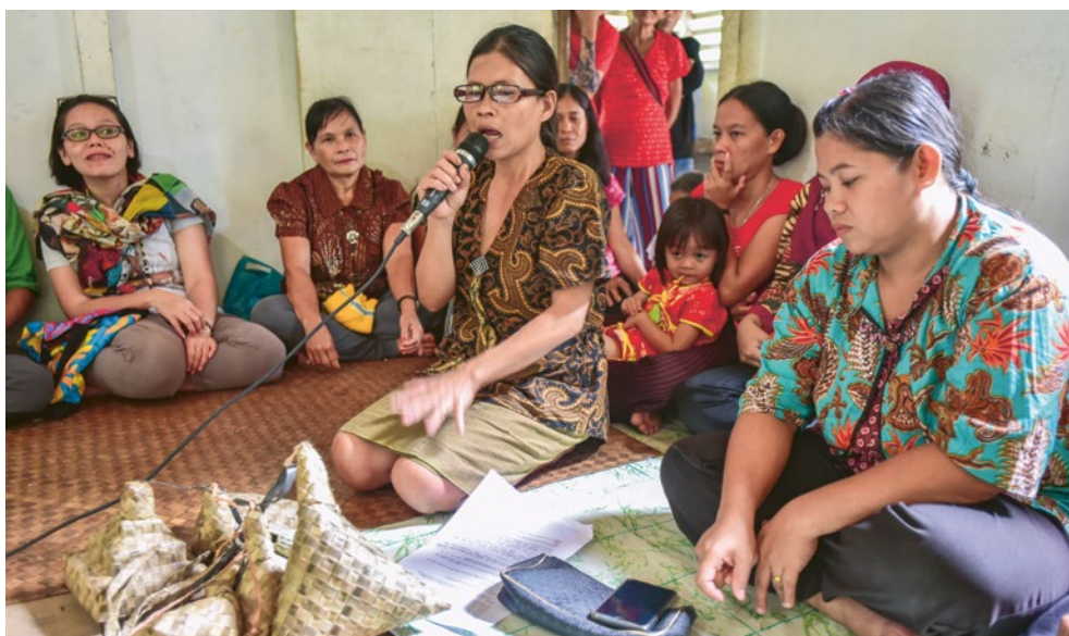
Versammlung von Frauen aus dem Dorf Silit in der Provinz West-Kalimantan.

Die politische Situation in Indonesien verschlechtert sich gegenwärtig massiv. Eine Herausforderung für Organisationen wie Walhi, die sich für die Rechte von Umwelt und Menschen engagieren.