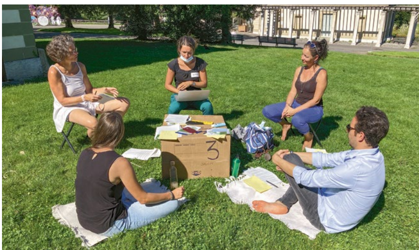
Die Transitions-Bewegung hat in den letzten Jahren auch in der Schweiz an Fahrt aufgenommen: Immer mehr Menschen suchen zusammen mit anderen nach neuen Wegen und Lebensformen.