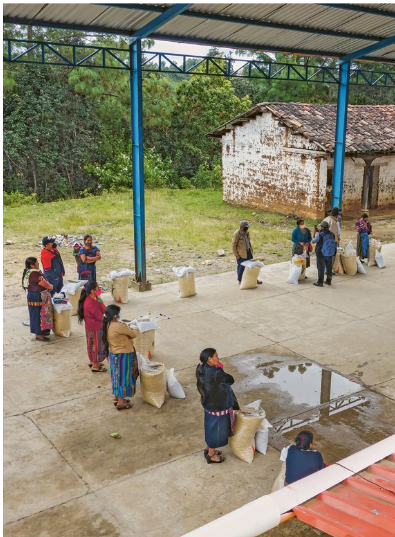
Verteilung der Nothilfepakete im Departamento Quiché im Norden von Guatemala. Die Lebensmittel stammten aus lokaler Produktion – ein innovativer, erfolgreicher Ansatz.

Zusammen mit ihrer Partnerorganisation erprobte Brot für alle in Guatemala während der Corona-Krise im Frühjahr 2020 neue Wege der Unterstützung.